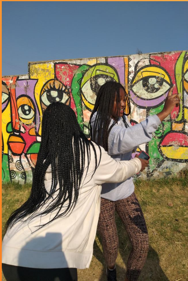
Kúltúrne rozdiely neboli problém a mali sme sa radi