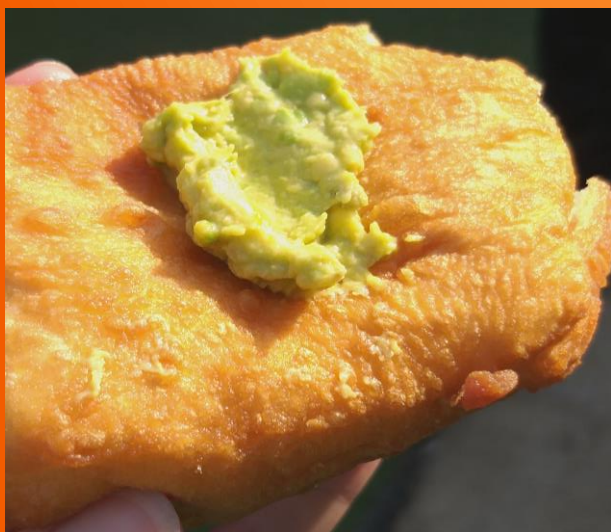
Poznajú aj naše pampúšky, tu ich volajú Fat cake