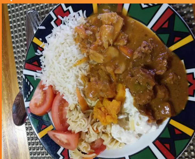
Ochutnali sme krokodíla aj pštrosa