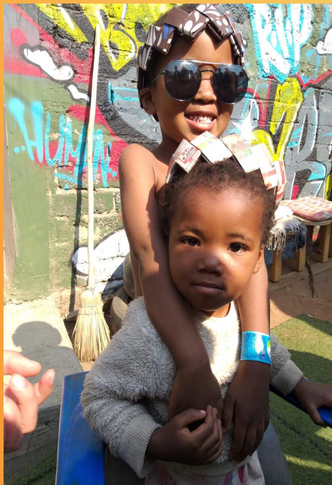
Deti zo Soweto